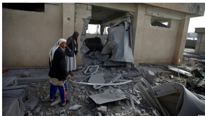
Obr. 3: Následky bombardování saúdským letectvem.

I navzdory tomu, že k embargu na Saúdskou Arábii vyzval Evropský parlament již v roce 2016, Česká republika ještě v roce 2017 této monarchii vyvezla zbraně a vojenský materiál v hodnotě 28 milionů eur. Za posledních pět